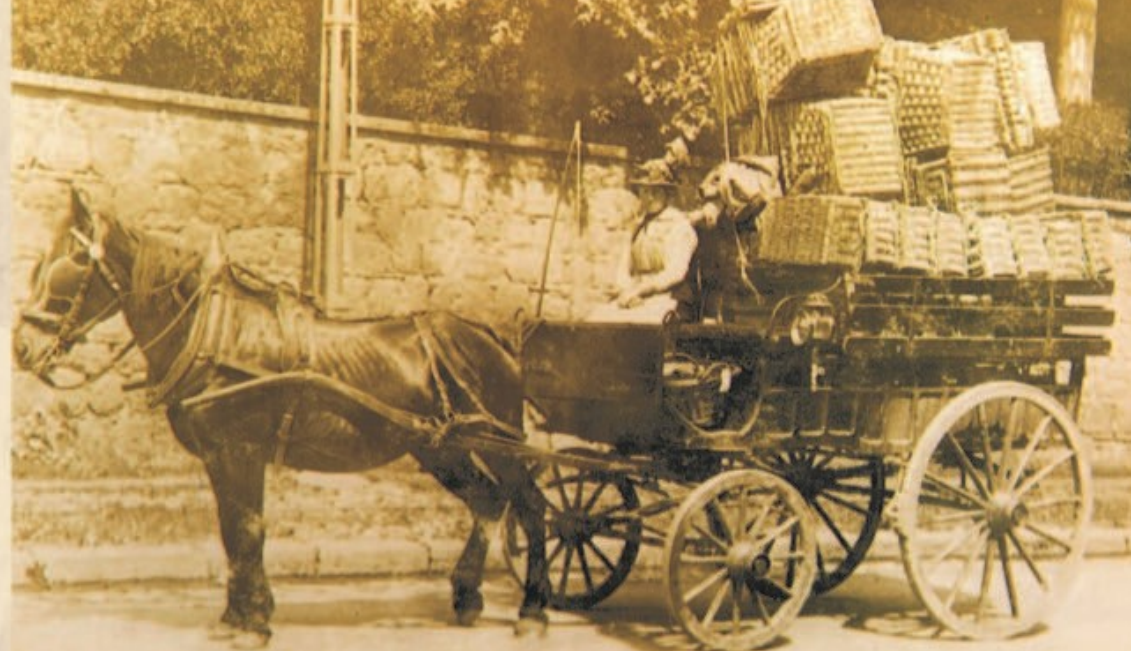
Coquetière livrant ses œufs à Soucieu en Jarrest vers 1920.

Création - Impression : TAPUCA - Mornant